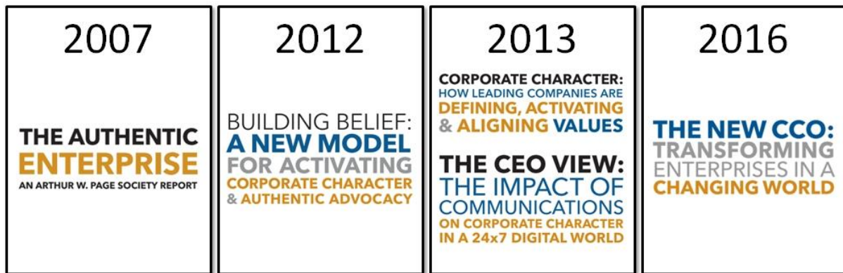
Abbildung 1: Die Publikationen der Arthur W. Page Society zum Thema CCO

Die Autoren von „The Authentic Enterprise“ sahen schon vor zehn Jahren voraus, dass die Verbindung dieser Strömungen zur Entstehung einer „Misstrauensgesellschaft“ führen würde, deren Herausforderungen mit traditioneller Unternehmenskommunikation nicht mehr zu bewältigen sein würden. Sie forderten, dass Unternehmen die Fähigkeit zum Dialog und Interessenausgleich mit einer Vielzahl von Stakeholdern entwickeln. Das hielten sie nur dann für möglich, wenn Kommunikationschefs in die Rolle eines „Chief Communication Officer“ hineinwüchsen, der die letztlich von allen Unternehmensangehörigen zu erbringende Reputationsarbeit anleitet, überwacht und steuert (Arthur W. Page Society 2007).